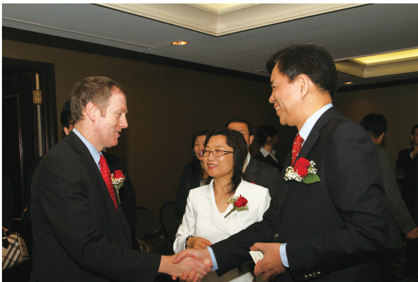
刘慧芸会长与吉林省委常委、副省长陈伟根