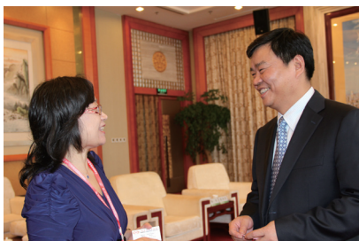
刘慧芸会长与湖南省副省长何报翔