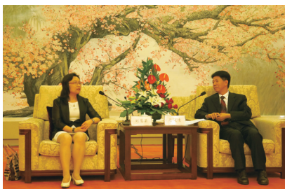
刘慧芸会长与吉林省委常委、常务副省长马俊清