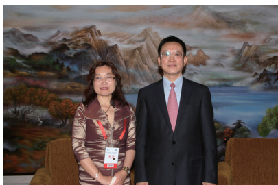
刘慧芸会长与吉林省副省长谷春立